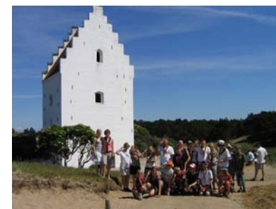
Fra sommerlejren i Skagen 2006

P.S. Forældre er velkommen til at deltage/besøge/overnatte – bare giv besked.